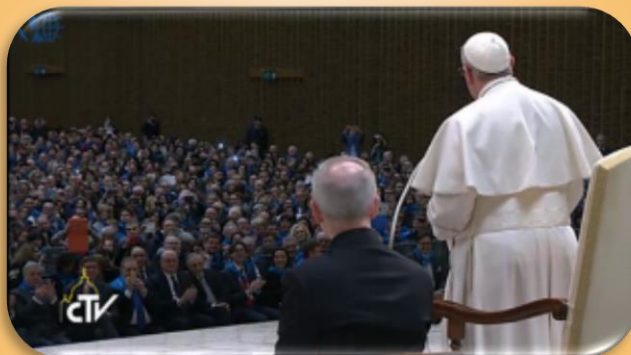
프란치스코 교황 ‘협동조합 강연중 ’